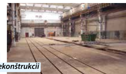
Počas a po rekonštrukcii