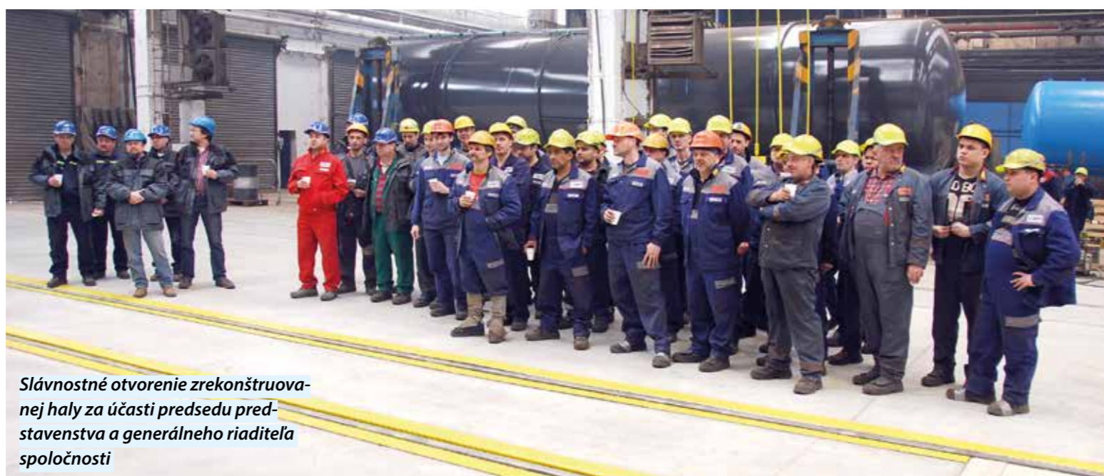
Slávnostné otvorenie zrekonštruovanej haly za účasti predsedu predstavenstva a generálneho riaditeľa spoločnosti

Teraz prišla na rad hala H4 loď č. 3, kde sa vyrábajú cisternové vozne. Ako sa hovorí, začalo sa rovno „od podlahy“. Tá dostala nový lesk a na nerovnosti, ktoré tam boli, už môžeme zabudnúť. Okrem zlepšenia vizuálneho stavu výrobných priestorov, nám ponúka dobrý základ do budúcnosti v rámci manipulácie s paletami, plošinami, prípravkami a manipulačnými vozíkmi. Po dokončení stavebných prác pribudnú označenia pre uličky, manipulačné priestory, skládky paliet s dielcami. To všetko v rámci zlepšenia